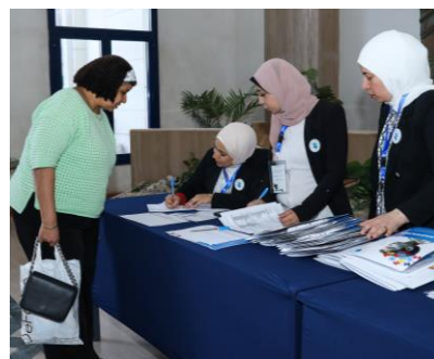
تسجيل حضور المؤتمر