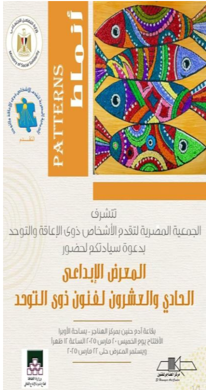
معرض فنون ذوي التوحد