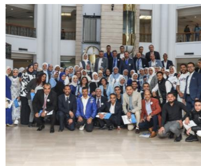
جزء من حضور المؤتمر