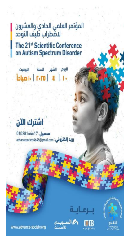
معرض فنون ذوي التوحد